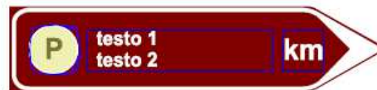
Fig 294 del Codice della strada svolta a destra