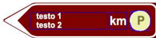
Fig 294 del Codice della strada svolta a sinistra